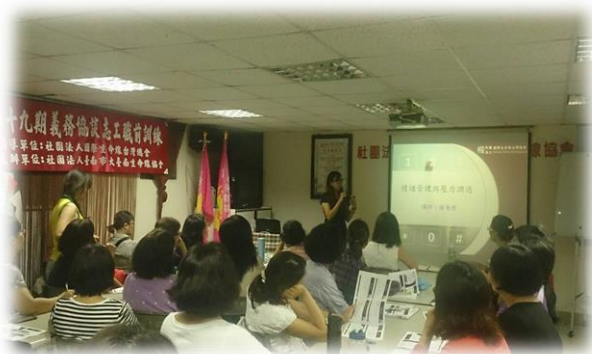
情緒管理與壓力調適