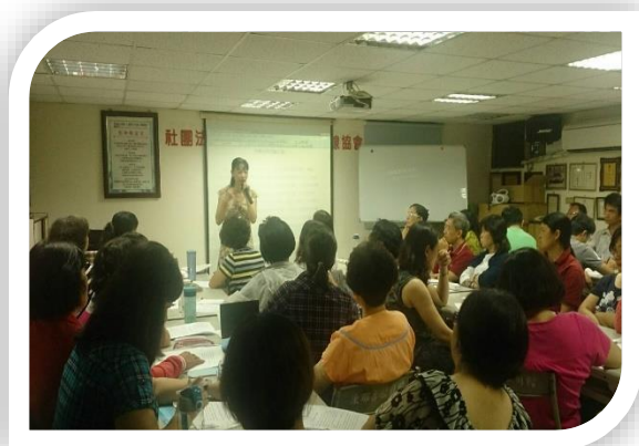
自我探索與覺察課程

大臺南生命線協會第十九期志工培訓，第一階段課程於 6 月 2 日順利開課，參加成員共 30 位，連續九周星期二晚上由專業講師授課自我探索一系列課程，分為兩班自我成長團體；上課對象來自不同領域，未來會加入協談輔導的行列，希望能提升這些成員對自我的認識與基礎輔導能力。